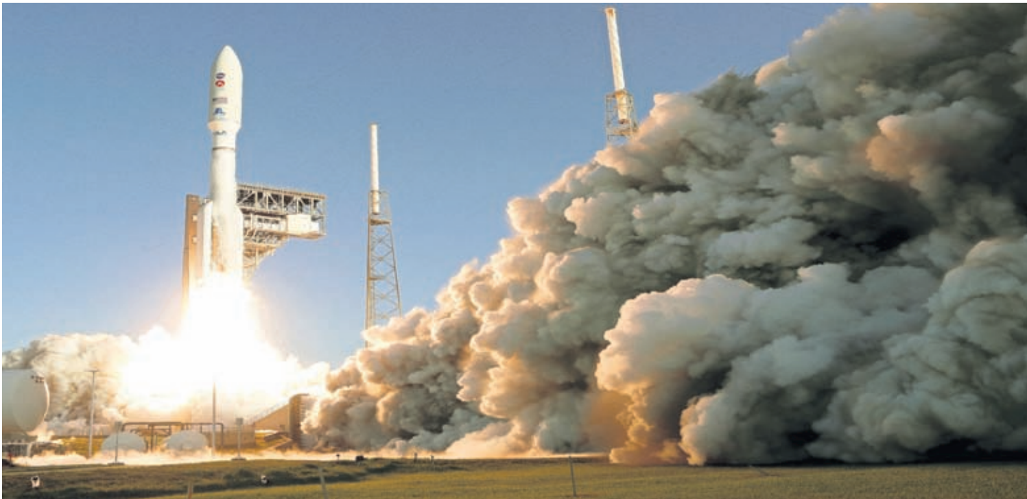
A United Launch Alliance Atlas V rocket lifts off from pad 41 at the Cape Canaveral Air Force Station Thursday, July 30, 2020, in Cape Canaveral, Fla.

By MARCIA DUNN AP Aerospace Writer CAPE CANAVERAL, Fla. (AP)